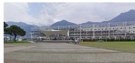
Porto Turistico (Lovere - BG)