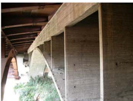
Viadotto Austrada A4 sul Fiume Brembo (Capriate San Gervasio - BG)