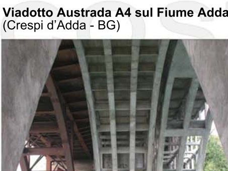
Viadotto Austrada A4 sul Fiume Adda (Crespi d'Adda - BG)