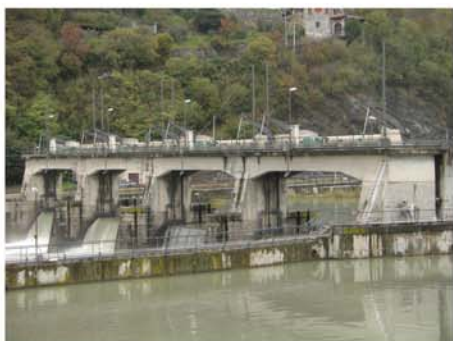
Centrale Idroelettrica di Paraviso (Pisogne - BS)