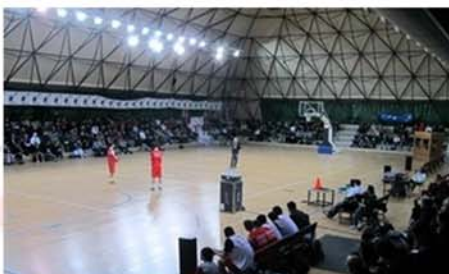
Tensostruttura Lido di Milano (Milano)