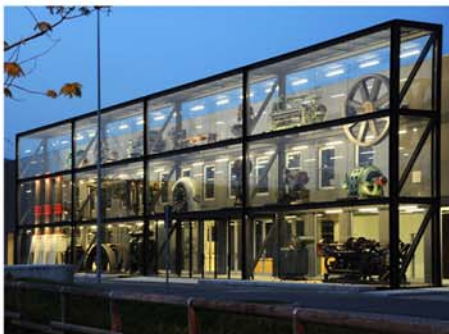
Struttura Espositiva presso il Musil (Rodengo Saiano - BS)