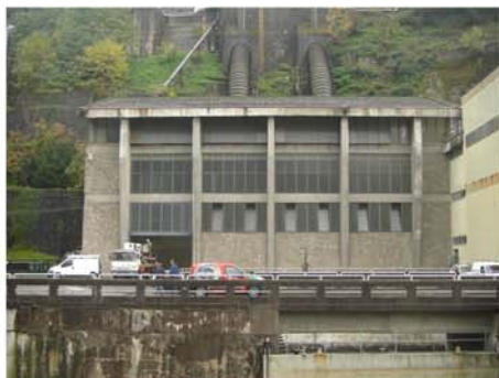
Opera di Presa (Esine - BS)