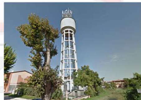
Torre Piezometrica (Manerbio - BS)