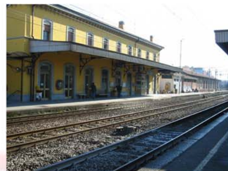
Stazione Ferroviaria (Vanzago - MI)