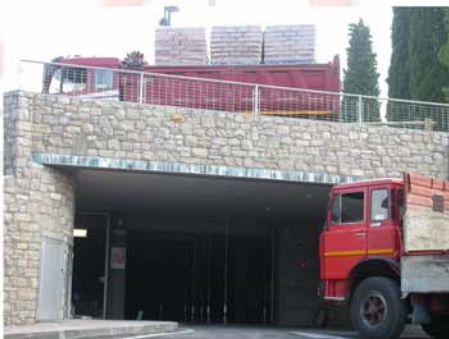
Parcheggio di Portese (San Felice del Benaco - BS)