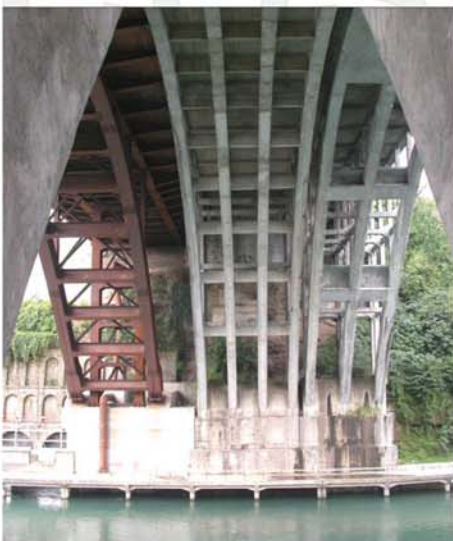
Viadotto Austrada A4 sul Fiume Adda (Crespi d'Adda - BG)